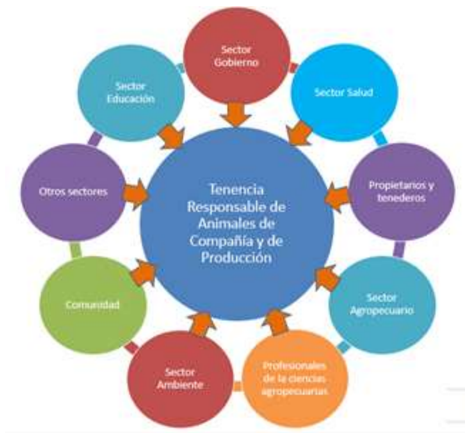
Ilustración 2. Actores involucrados en la formulación de la Política de Tenencia Responsable de Animales de Compañía y de Producción

De igual manera podemos ver que la comunidad, las Organizaciones No Gubernamentales y las agremiaciones, desempeñan un papel importante en la formulación de las intervenciones que hacen parte de la Política Pública para garantizar el bienestar y la protección de los animales.