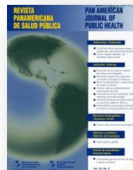
Revista Panamericana de Salud Pública