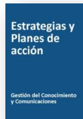
Estrategia y Plan de acción de Gestión del Conocimiento y Comunicaciones OPS/OMS (2012) (propuesta)