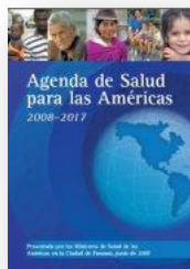
Agenda de Salud para las Américas 2008-2017