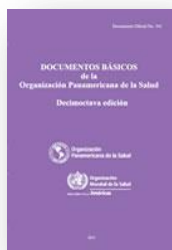
Documentos básicos de la OPS (2012)