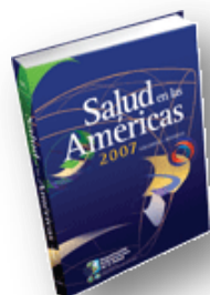
Salud en las Américas 2007