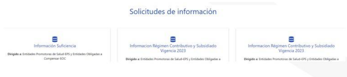
Ilustración 3. Pantalla de solicitudes de información

Busque la solicitud de información que se llama “Estudio técnico UPC 2027” (Reporte Anual) y oprima el botón reportar y posteriormente, visualiza la pantalla de inicio del proceso para el estudio técnico UPC 2027: