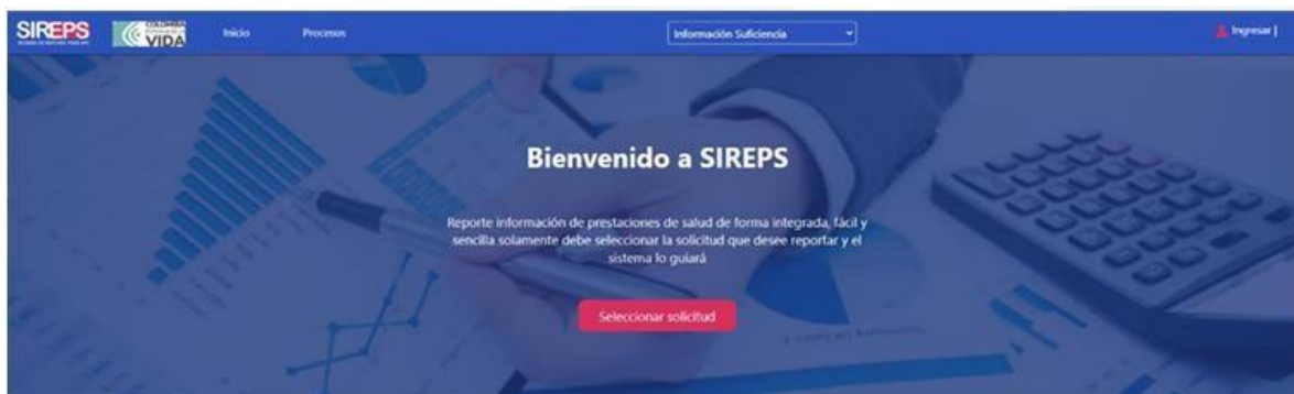
Ilustración 1. Página inicial SIREPS

Deberá visualizar la siguiente pantalla: