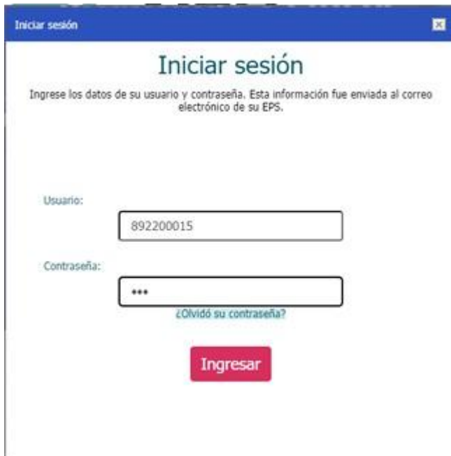
Ilustración 2. Página de credenciales

Ingrese la información y oprima el botón ingresar.