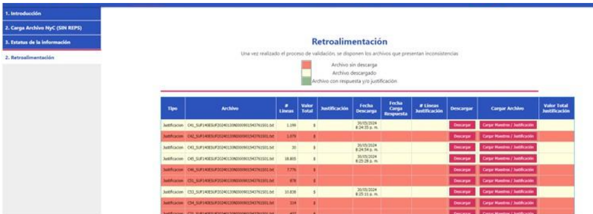
Ilustración 4. Pantalla retroalimentación

Los archivos se visualizan utilizando el siguiente semáforo: