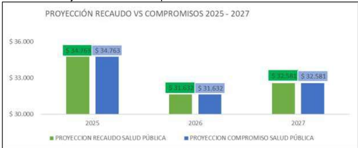
Proyección de recaudo vs compromisos 2024–2027 – Norte de Santander