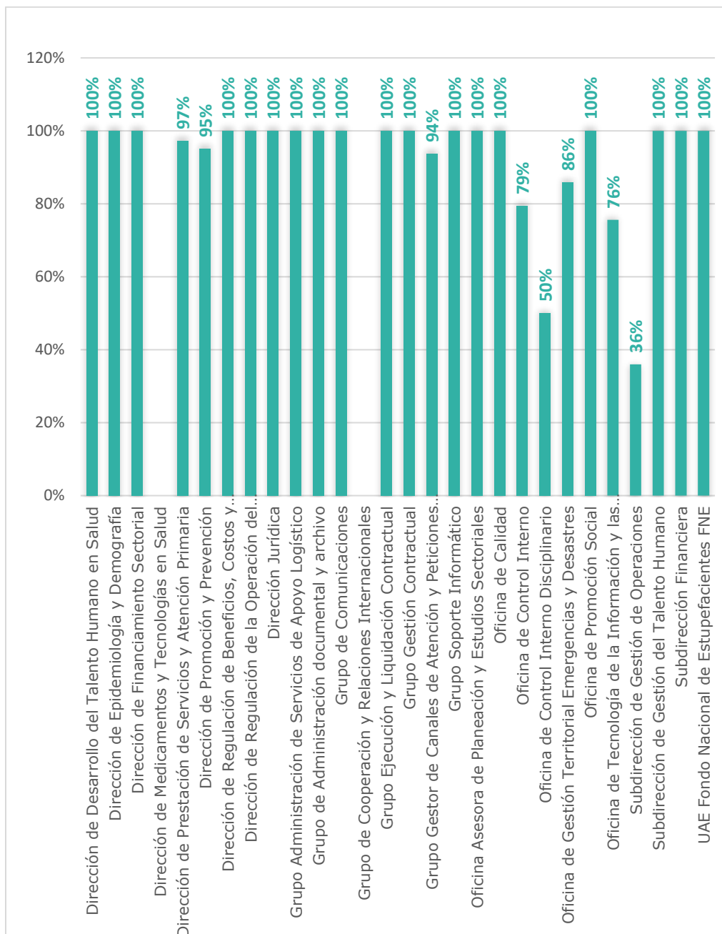
Gráfico 3. Porcentaje promedio de cumplimiento de metas físicas programadas