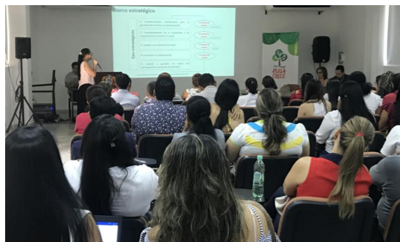
Secretaría Departamental de Salud de Huila

La coordinación para el desarrollo de estos espacios técnicos de trabajo, permitió convocar y contar con una amplia participación institucional de los diferentes actores del sistema de salud, fortalecer las capacidades de los equipos y generar interacciones con otras áreas estratégicas de las entidades como Salud pública, Aseguramiento, Planeación, Comunicaciones y prensa, entre otras, con las que es fundamental concretar agendas conjuntas de trabajo para posicionar y transversalizar la PPSS.