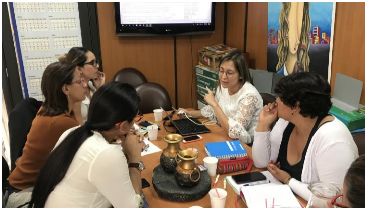
Secretaría Departamental de Salud de Boyacá. Lugar MSPS.

Teniendo en cuenta que la implementación de la PPSS se viene dando de manera gradual en el país y que se requiere continuar trabajando en la apropiación y comprensión de los elementos que componen su marco estratégico para garantizar su efectiva operación, se desarrolló una agenda que de manera pedagógica permitió abordar aspectos como el contexto para su formulación, así como la ruta operativa y el marco estratégico, haciendo énfasis en la integración y despliegue de las líneas de acción a través de los tres macro-procesos que contempla la PPSS: Gestión, Comunicación y Educación.