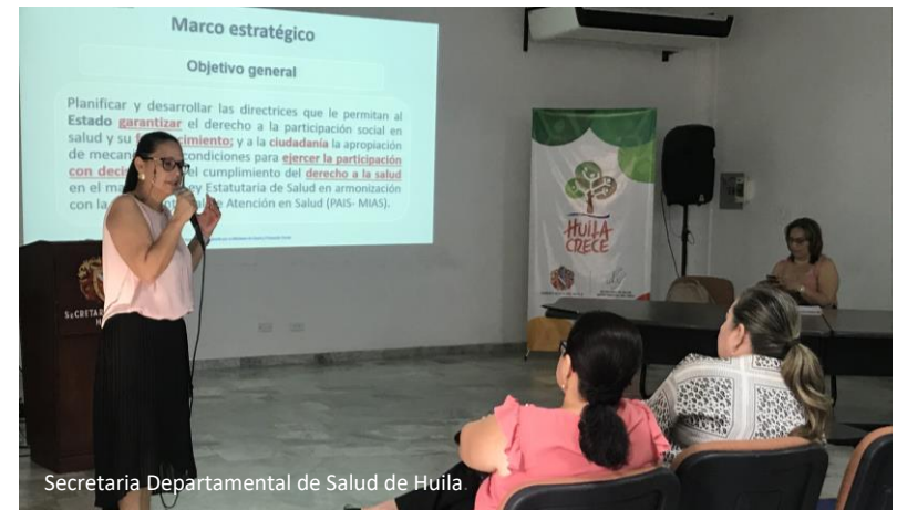
Secretaría Departamental de Salud de Huila.

Posteriormente se profundizó en el aporte de orientaciones técnicas centradas en un abordaje detallado de los ejes estratégicos y sus líneas de acción, para cualificar la formulación de acciones de la PPSS para la vigencia 2020. Se hizo especial énfasis en ampliar la comprensión de los alcances de cada línea, teniendo en cuenta que responden a objetivos particulares definidos por la PPSS, además de la necesidad de integrarlas con los procesos de gestión, educación y comunicación, como criterio base para el diseño de las metas y actividades a concretar en los planes de acción. Se plantea como prioridad el abordaje integral del marco estratégico de la PPSS como mecanismo que permitirá responder a criterios de pertinencia y coherencia frente a las necesidades y potencialidades de participación en salud de cada territorio. Este proceso se acompañó de la socialización y puesta en práctica de nuevos instrumentos desarrollados por el equipo técnico del MSPS para este fin.