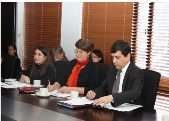
Imagen de la VII sesión del CND, febrero 2012

El tema del proceso de construcción del nuevo Conpes sobre la Política Nacional de discapacidad, priorizado en el Plan Nacional de Desarrollo “Prosperidad para Todos” 2010 – 2014, se incluyó en las agendas de la segunda y octava sesiones del CND. El DNP suministró la información y orientación para su elaboración, dando lugar a la definición de estrategias bajo el liderazgo del GES, como instancia técnica del Sistema Nacional de Discapacidad.