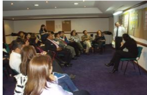
Imagen de jornada de trabajo CND-GES, agosto de 2011

El GES presentó en la segunda sesión del CND, el día 28 de julio de 2011, una propuesta al CND sobre el Plan Nacional de Discapacidad, el cual fue analizado en el marco del taller realizado el 11 de agosto de 2011. El Plan se aprobó en la séptima sesión del CND, el día 22 de febrero de 2012.