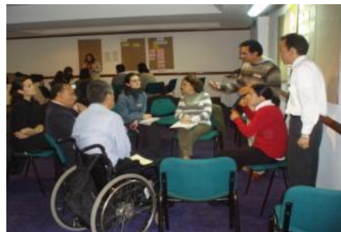
Imagen de jornada de trabajo, julio de 2011