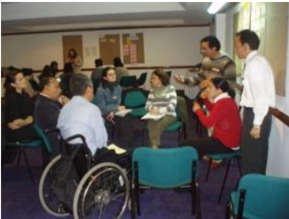
Imagen de jornada de trabajo CND-GES, agosto de 2011

El Grupo de Enlace Sectorial -GES, es la instancia técnica de construcción, concertación y coordinación interinstitucional de planes, proyectos y programas a someter a consideración del Consejo Nacional de Discapacidad. Ha realizado las siguientes actividades: