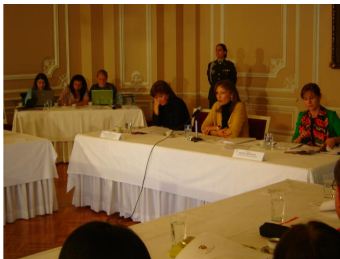
Imagen de primera sesión del CND, mayo 2011. Secretaría Técnica al fondo

El Ministerio de Salud y Protección Social en el ejercicio de la Secretaría Técnica del Consejo Nacional de Discapacidad, ha desarrollado las siguientes actividades: