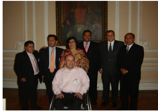
Imagen de la Instalación y Sesión I, 26 de mayo de 2010

Desde su instalación el 26 de mayo de 2010 se han realizado 8 sesiones y se han tratado entre otros, los siguientes temas.