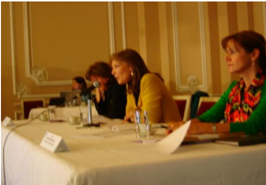
Imagen de la Instalación y Sesión I, 26 de mayo de 2010

La Ley 1145 de 2007, establece la conformación del Consejo Nacional de Discapacidad -CND como el nivel consultor y de asesoría del Sistema, de carácter permanente, para la coordinación, planificación, concertación, adopción y evaluación de las políticas públicas generales y sectoriales para el sector de la discapacidad en Colombia.